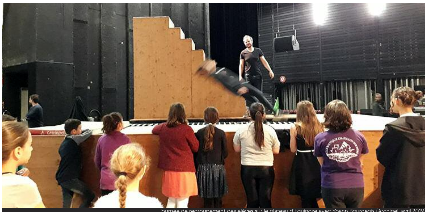
Journée de regroupement des élèves sur le plateau d'Equinoxe avec Yoann Bourgeois (Archipel, avril 2019)

Lycée Naturapolis (Châteauroux); collège Rollinat (Argenton-sur-Creuse); collège George Sand (La Châtre); collège Ferdinand de Lesseps (Vatan); écoles élémentaires Joseph Pécherat et Clairefontaine (Levroux); IME Chantemerle (Valençay); Groupe d'adolescents et de jeunes adultes amateurs (Châteauroux).