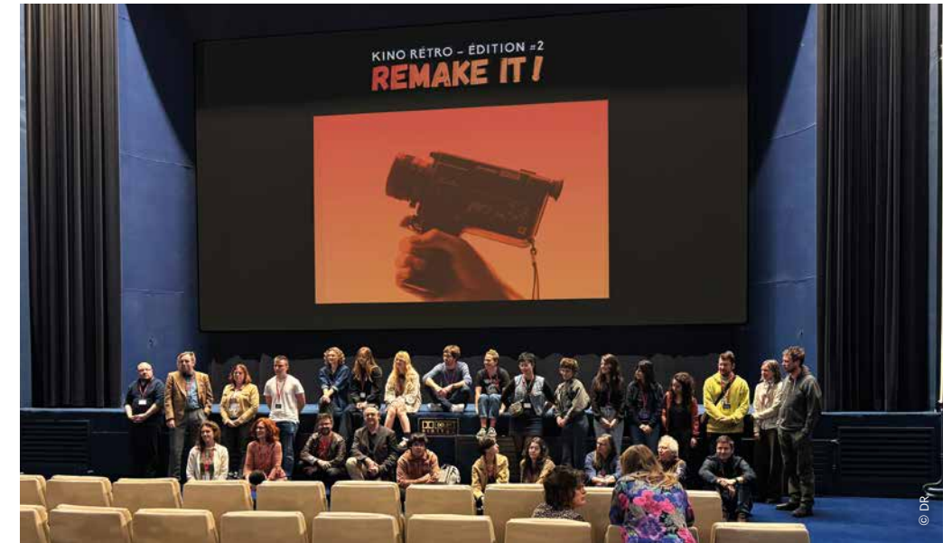
Les cinéastes du KINO RÉTRO #2 lors du festival Retours vers le futur le 6 avril.