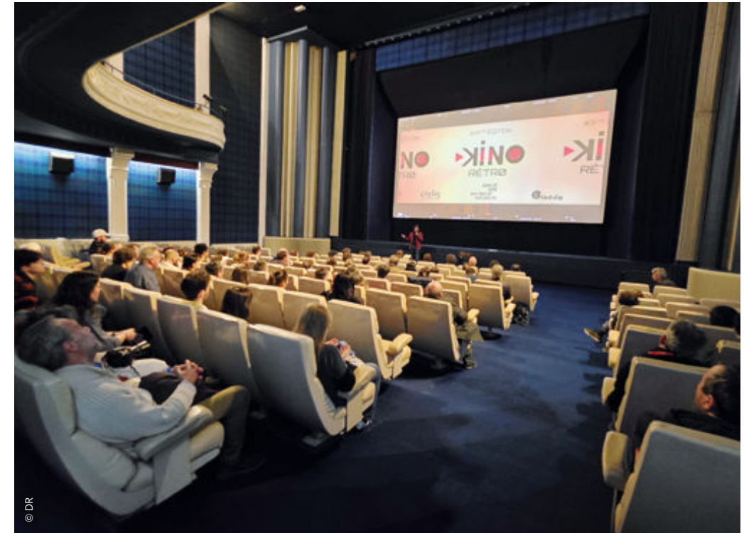
Kino Rétro #3, le samedi 5 avril.

En couverture : Exit Above De Anne Teresa De Keersmaeker